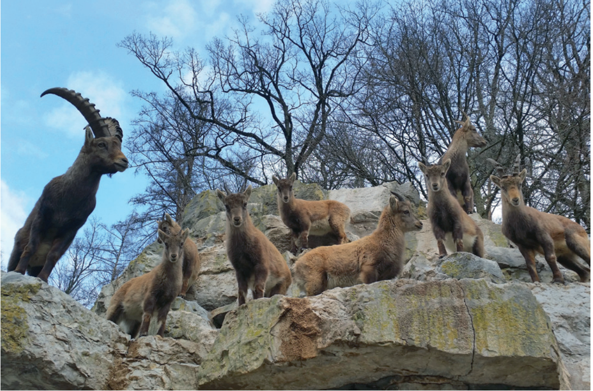
Steinböcke gehören genauso zum Wildnispark Zürich Langenberg wie viele andere einheimische oder ehemals einheimische Wildtiere.

tanzen etwa die Mäuse auf dem Küchentisch, machen sich die Ratten über den Vorratskeller her und nisten sich die Siebenschläfer rotzfrech in der Garage ein.