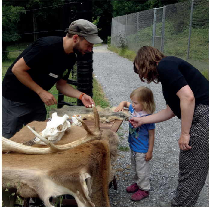
Links: Von der kleinen Hausmaus bis zum grossen Braunbären leben heute auf dem Langenberg ganz unterschiedliche Tiere. Rechts: Die Wildnisbotinnen und Wildnisboten vermitteln auf anschauliche Weise interessante Hintergründe zu den einheimischen Tierarten.