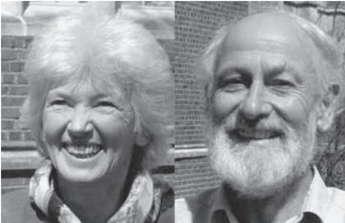
Peter und Rosmary Grant (GB/USA)

Peter und Rosmary Grant haben sich durch ihre bemerkenswerten, über einen langen Zeitraum durchgeführten Studien über die Evolution der Finken auf den Galapagos-Inseln hervor getan. Dabei haben sie beschrieben, wie schnell sich die Grösse von Körper und Schnabel als Folge veränderter Nahrungsbedingungen und natürlicher Selektion verändern. Darüber hinaus haben sie die dem Entstehen neuer Arten zu Grunde liegenden Mechanismen aufgezeigt und die